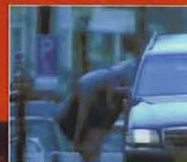
Franciska: 'Ik speel in de clip letterlijk de hoer - want ik ben geen straat- of raamprostituee - maar dit was gewoon een normale, betaalde opdracht.'