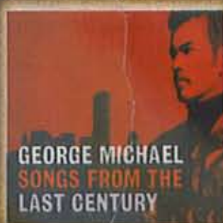
GEORGE MICHAEL SONGS FROM THE LAST CENTURY